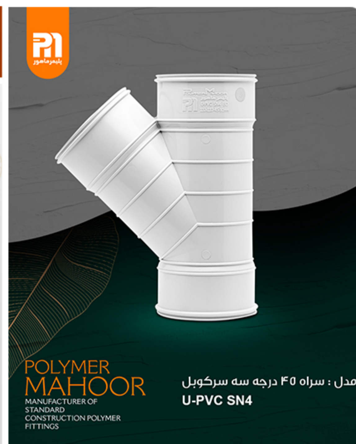
مدل : سراه ۴۵ درجه سه سر کوبل U-PVC SN4