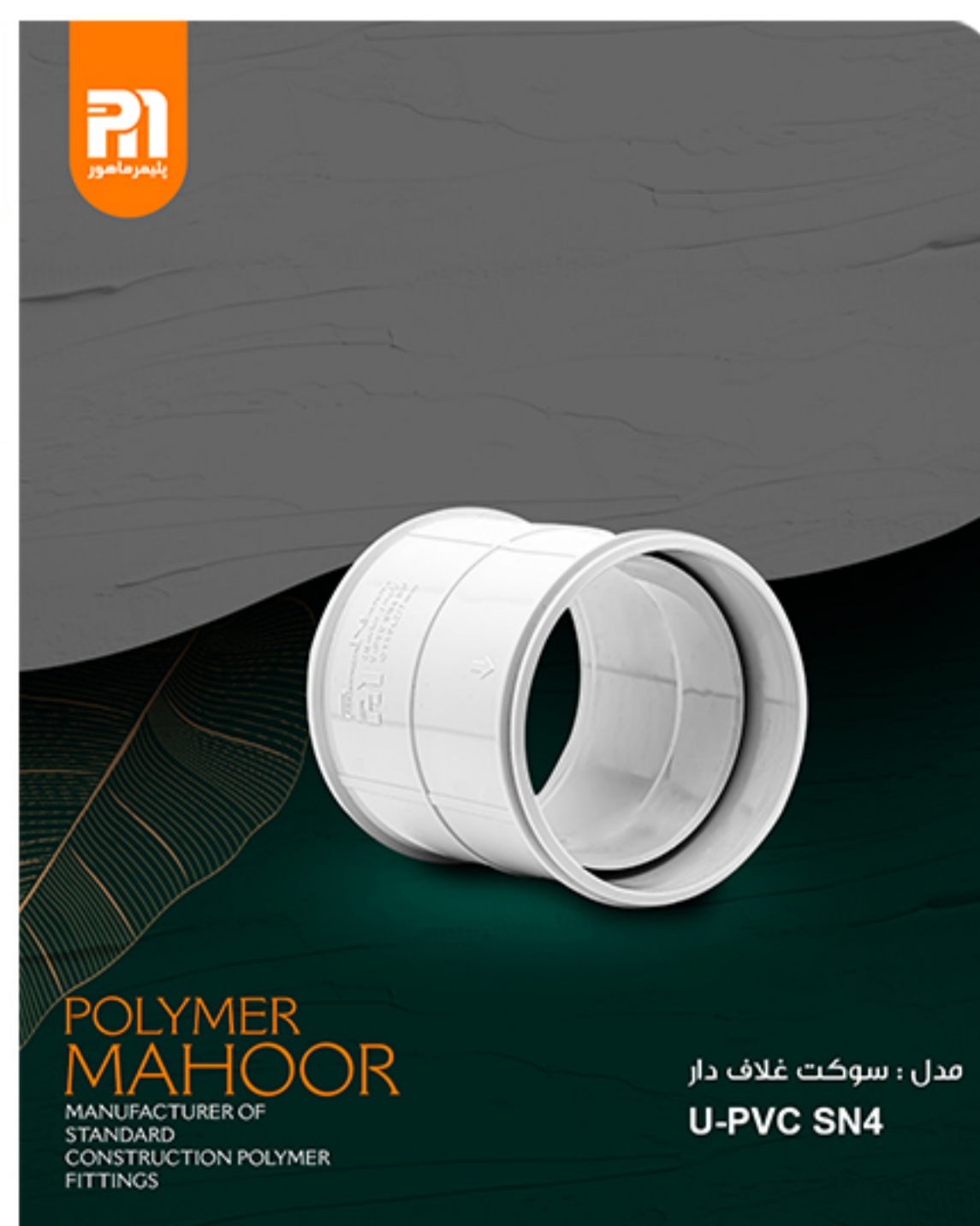
مدل : سوکت غلاف دار U-PVC SN4