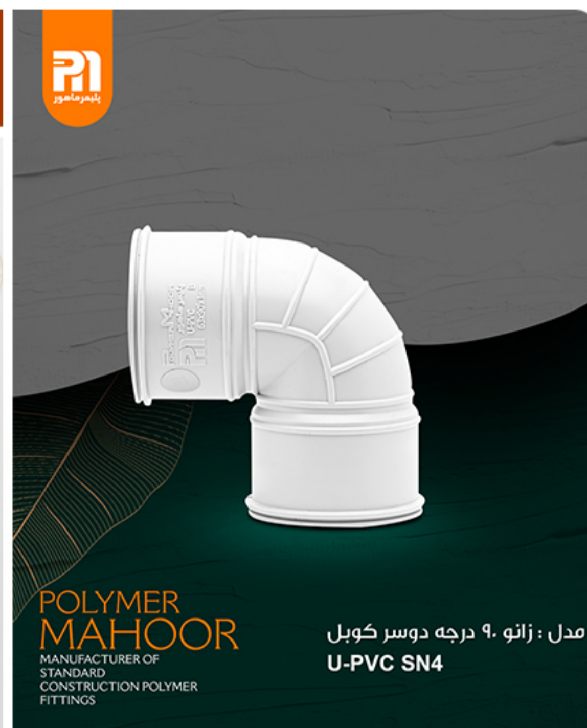
مدل : زانو ۹۰ درجه دوسر کوبل U-PVC SN4