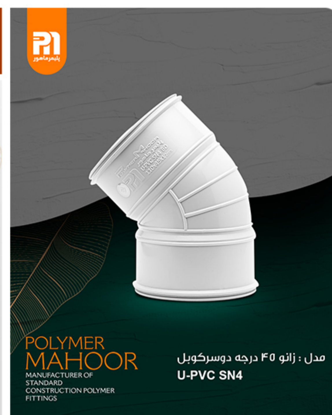
مدل : زانو ۴۵ درجه دوسر کوبل U-PVC SN4