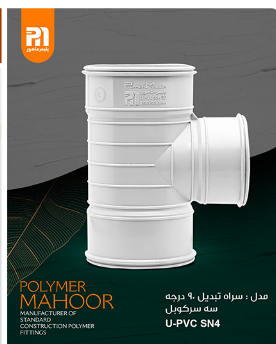
مدل : سراه تبدیلی ۹۰ درجه سه سر کوبل U-PVC SN4