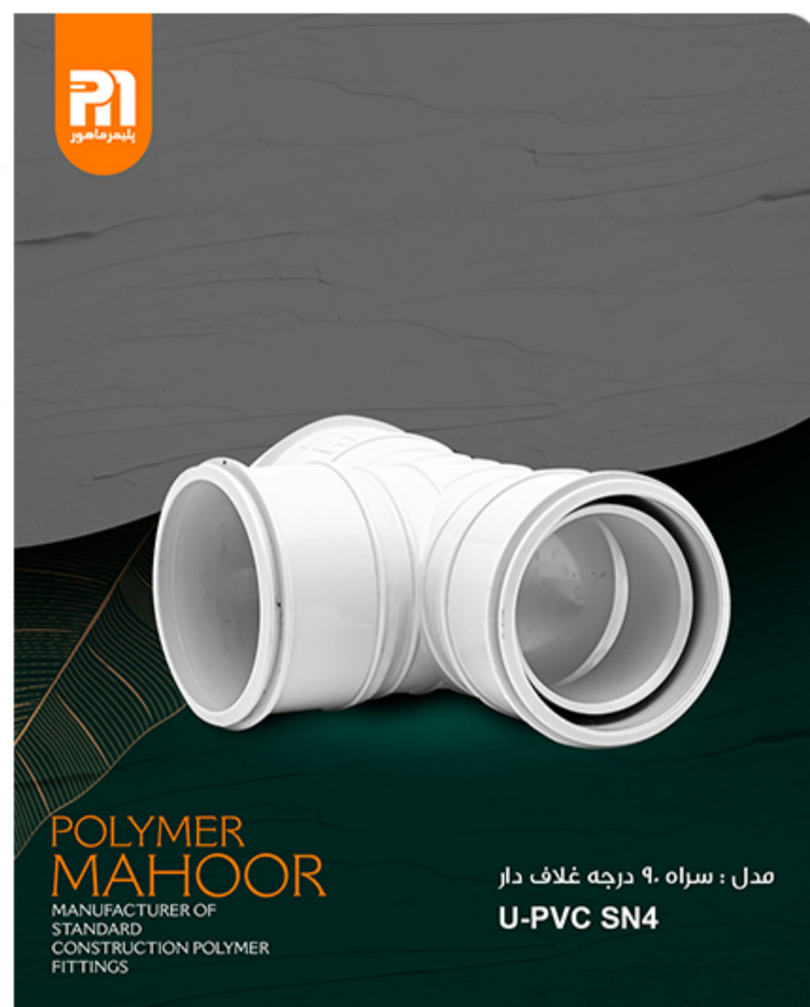
مدل : سراه ۹۰ درجه غلاف دار U-PVC SN4