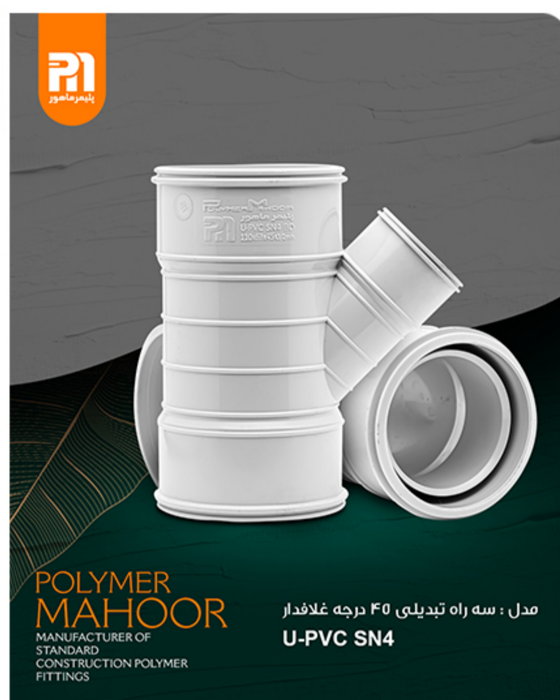
مدل : سه راه تبدیلی ۴۵ درجه غلاف دار U-PVC SN4