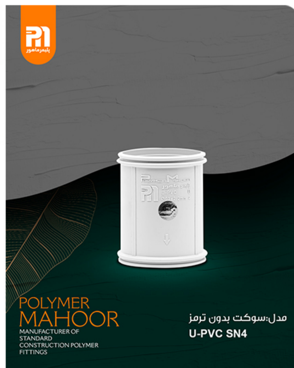
مدل : سوکت بدون ترمز U-PVC SN4