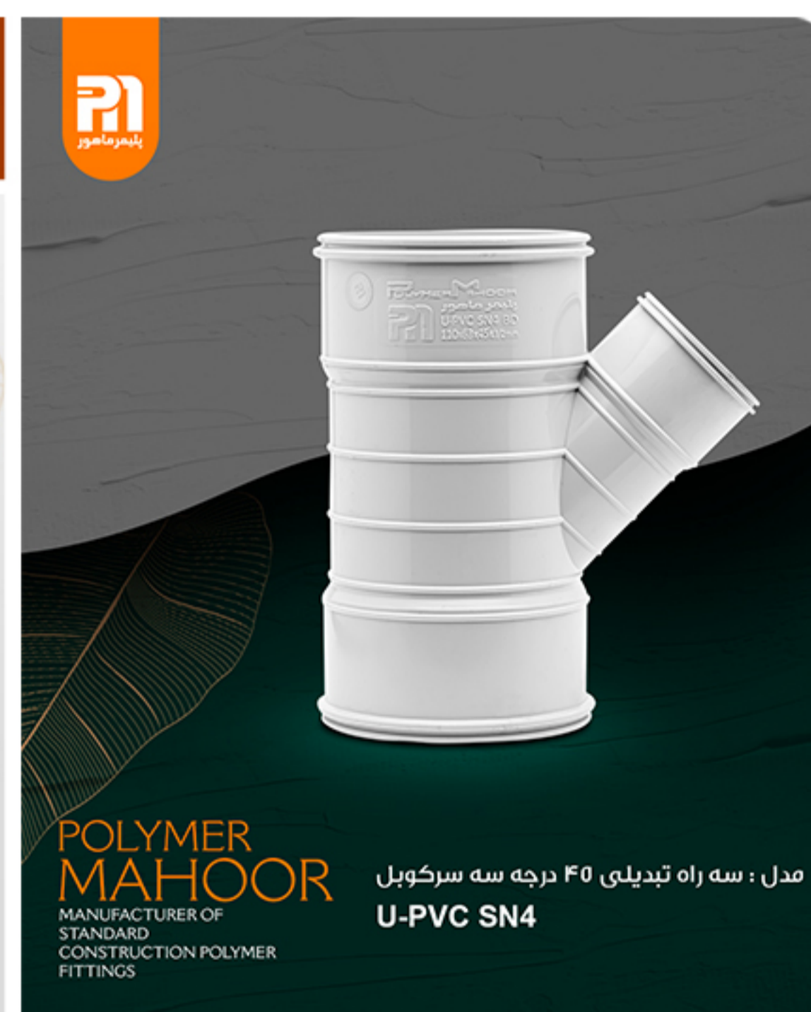
مدل : سه راه تبدیلی ۴۵ درجه سه سر کوبل U-PVC SN4